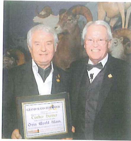
Ovis World Slam Ödülü - 2009