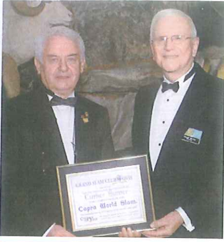
Capra World Slam Ödülü - 2007