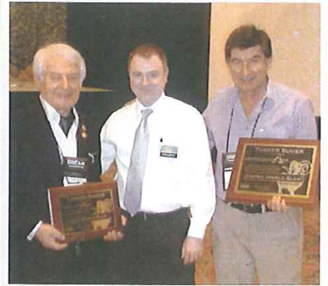
Dünyada büyük bir başarıyı üç dalda birden gerçekleştiren ilk Türk Avcısını muhabbetle ve avcı ağırbaşlılığı ile tebrik ediyorlardı.